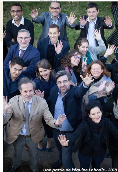
Une partie de l'équipe Lobodis - 2018

En 2019, un groupe de travail issu du comité RSE s'est formé rassemblant 3 collaborateurs volontaires de l'entreprise pour élaborer un questionnaire Qualité de Vie au Travail (QVT). Il a été diffusé en décembre 2019, et un plan d'action QVT a été établi par la suite. Nous accordons une grande importance à construire ensemble la démarche et faire de la Qualité de Vie au Travail une brique essentielle de la stratégie de l'entreprise.