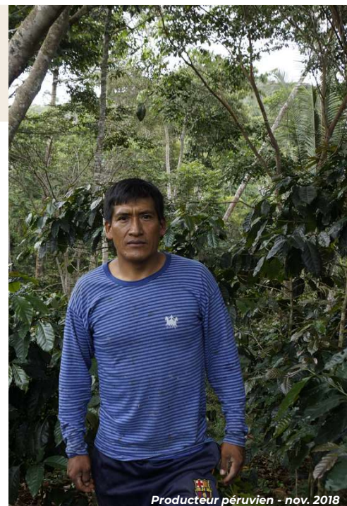
Producteur péruvien - nov. 2018