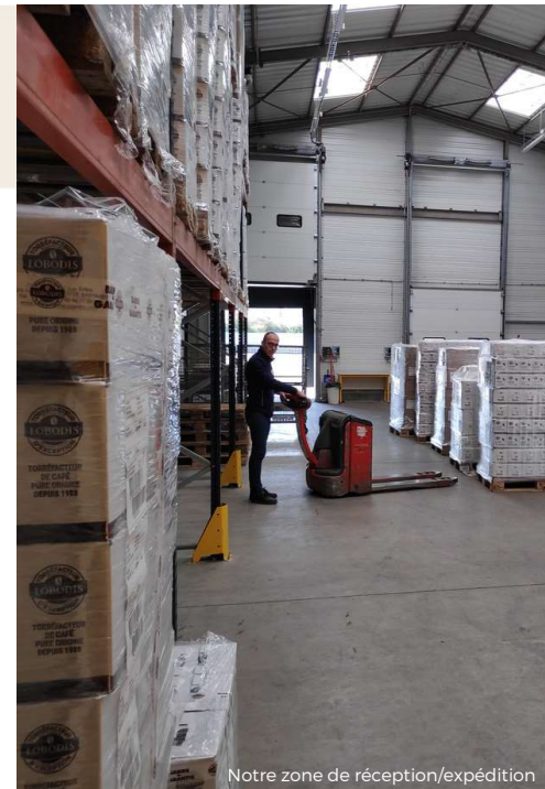
Notre zone de réception/expédition

Avec l'ESAT "CAT Notre Avenir", nous avons également mis en place un suivi des consommations d'énergies et d'eau, basé sur des relevés de compteurs et sous-compteurs pour avoir une analyse fine. Nous travaillons ensemble sur les plans d'actions de réduction, avec pour objectif de lisser les consommations en optimisant les usages.