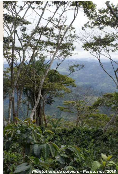
Plantations de caféiers - Pérou, nov. 2018