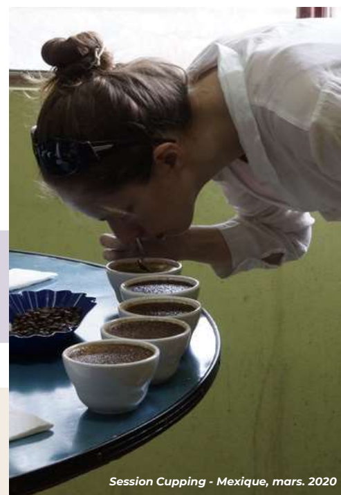
Session Cupping - Mexique, mars. 2020