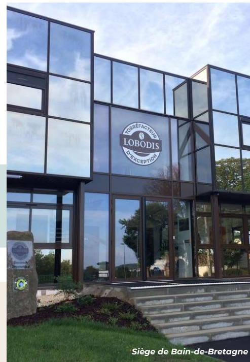
Siège de Bain-de-Bretagne