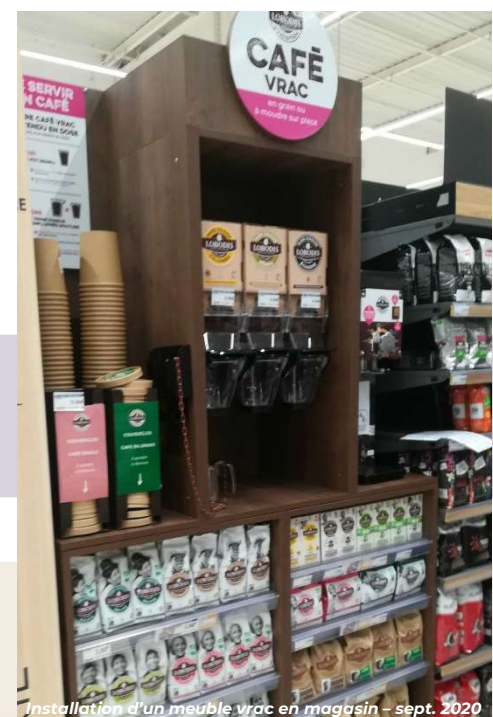
Installation d'un meuble vrac en magasin - sept. 2020