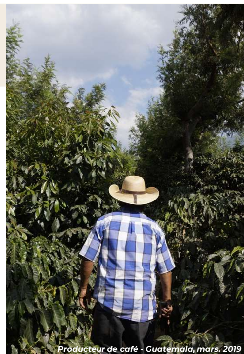
Producteur de café - Guatemala, mars. 2019

Ces cafés rares (1% de la production mondiale) nécessitent l'excellence à chaque étape : parcelles durables de haute altitude, récolte minutieuse et manuelle, traitement par voie humide, voie sèche ou les deux, transport, torréfaction spécifique pour révéler tous les arômes de ces cafés d'exception.