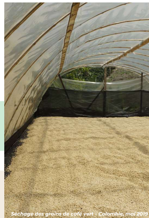
Séchage des grains de café vert - Colombie, mai 2019