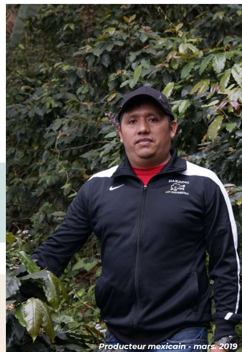
Producteur mexicain - mars. 2019